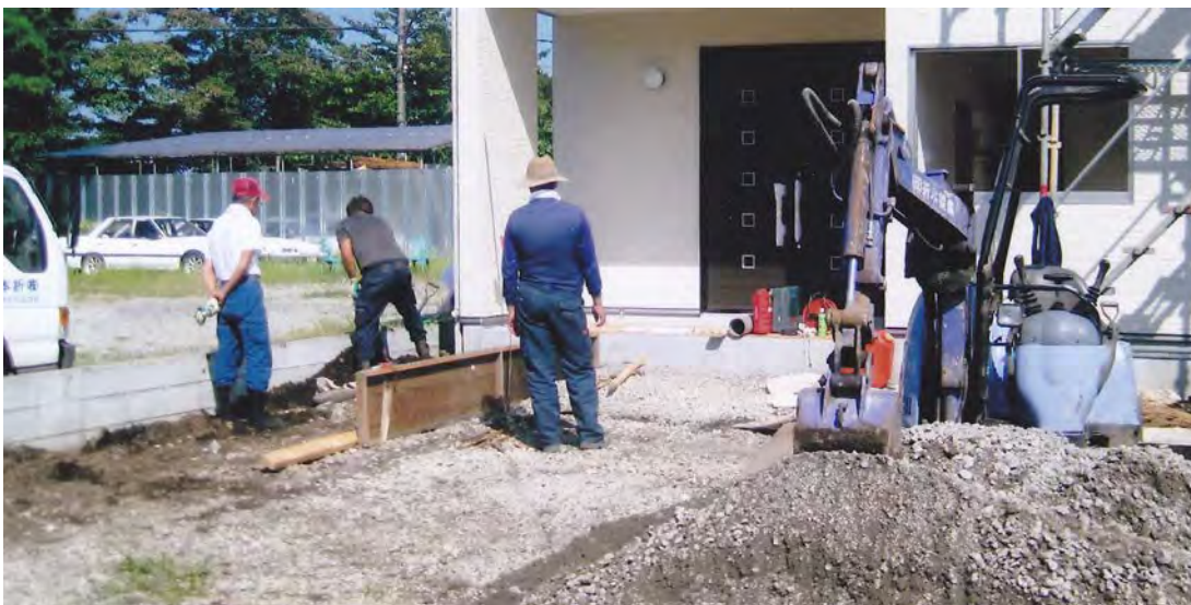
自治会員によるスロープ工事