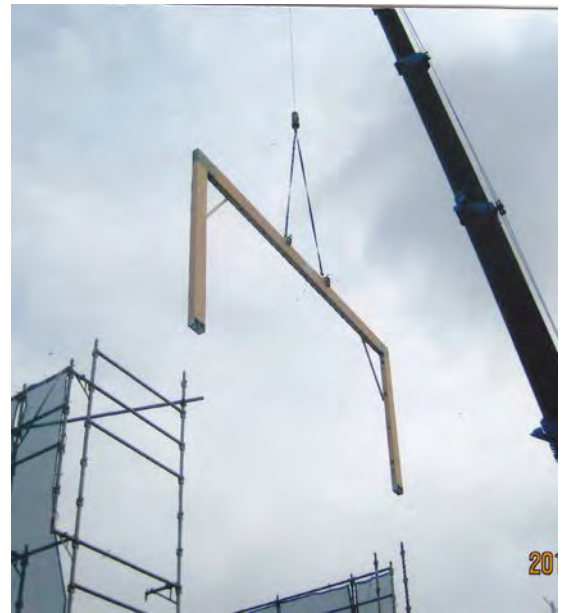
ホールの柱の設置 工場から直送