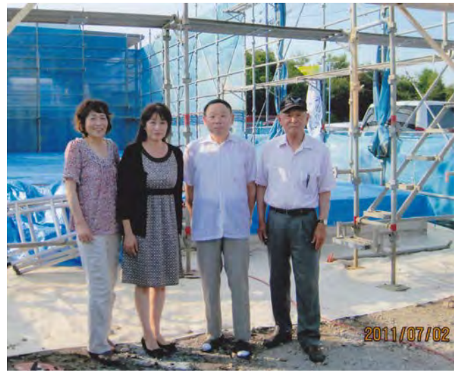
工事をみまもってくださった皆さん