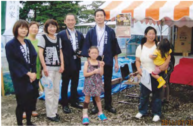
工作教室（記念イベント） 7月30～31日

工事記録の写真は、御園南自治会のホームページ ( http://members.jcom.home.ne.jp/misono-minami/ )でも公開の予定です。