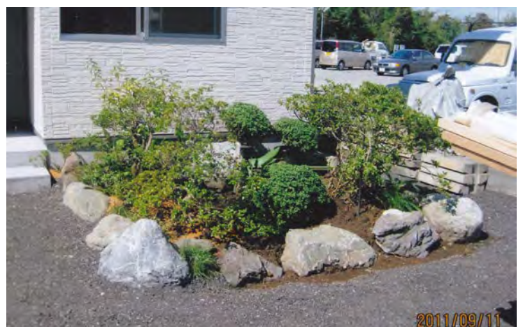
植栽 たくさんの植木の寄付をいただきました