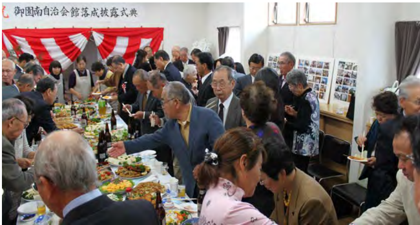
近隣自治会や工事関係、約80名のご参加をいただきました