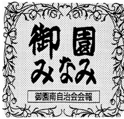
第2号の題字を復刻しました

資源ゴミはできるだけ第3日曜日の子ども会の資源回収に出すようご協力お願いします。