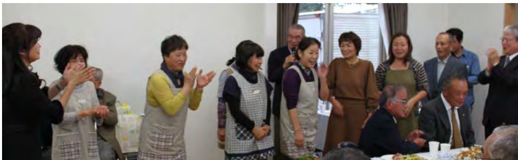
落成記念式典をささえた皆さん