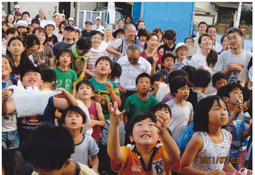
上棟式「投げ餅」にあつまった皆さん